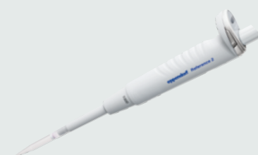
Abb: Bsp. Eppendorf Reference® 2, variabel, Einkanal