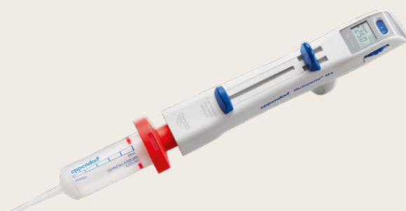
Abb: Eppendorf Multipette® M4 (Listenpreis 362,00 €)

In diesem Jahr feiert Eppendorf sein 75-jähriges Jubiläum. Das möchten wir mitfeiern und haben ein attraktives Angebots-Paket für Sie geschnürt.