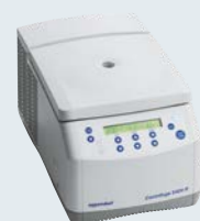
Abb: gekühlte Variante mit Folientastatur